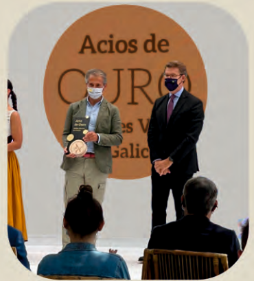
Albariño Pazo de Rubianes, mejor vino de Galicia 2021