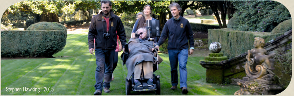
Stephen Hawking | 2015